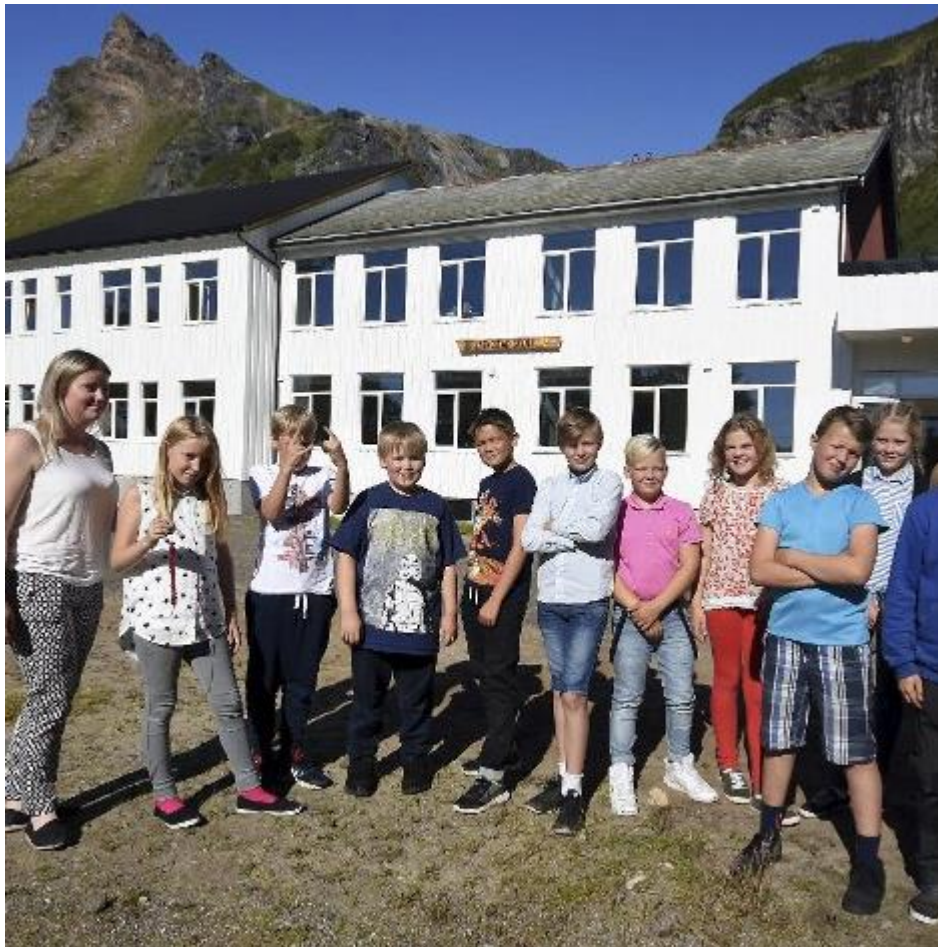
Renovert skole høsten 2017.

SIN møter mange talent ute i vårt arbeid med amatører, noen få ganger møter vi noen som tar helt pusten fra oss, og i Steigen har de en av disse ungene. Dette talentet hadde en ledende rolle i forestillingen på Laskestad, og hele forestillingen blir løftet av at en kan bære så mye. Vi håper og tror også at SIN bidrar til at disse talentene løftes og får ekstra utfordringer som kan ta dem videre.