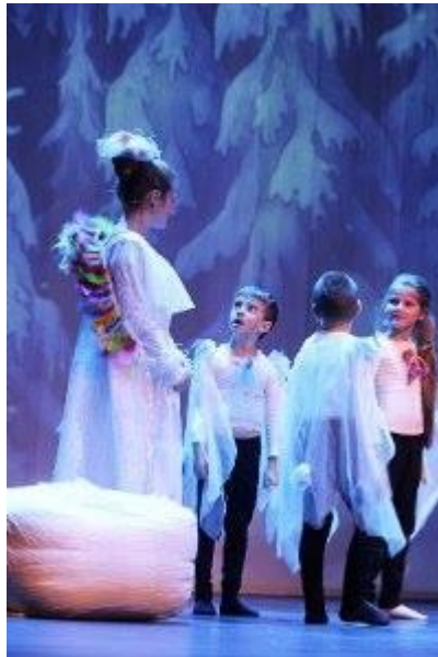
Bilde fra da gruppen deltok i Vefsn Kulturskoles forestilling «Reisen til julestjernen».